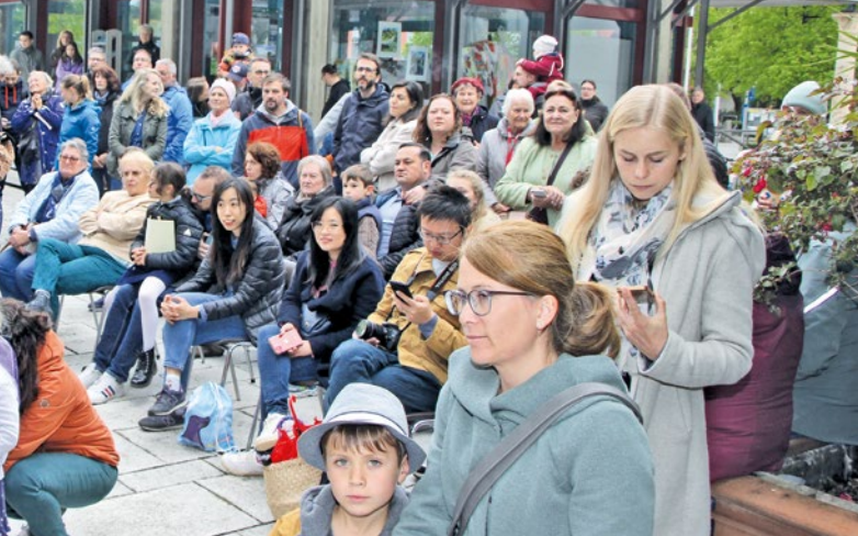
her beim Konzert am Rathausplatz