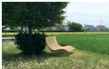
Aus dem Bürgerhaushalt 2019: Relaxliege

Im Jahr 2019 hat die Gemeinde Neufahrn den Bürgerhaushalt eingeführt. Mit einem Gesamtetat von 30.000 € wurde Neufahrner Bürger:innen die Möglichkeit gegeben, aktiv bei der Planung öffentlicher Ausgaben mitzuwirken und Vorschläge für den Haushalt einzubringen. Aus dieser Ideensammlung sollten dann jährlich konkrete Verbesserungen für die Gemeinde umgesetzt werden. Inzwischen hat der Neufahrner Gemeinderat entschieden, den Bürgerhaushalt zukünftig in zweijährigem Turnus mit einem aufgestockten Etat von 100.000€ abzuhalten.