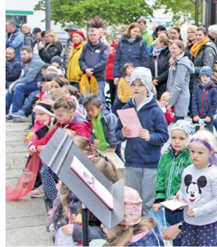
Viele interessierte Besucherinnen und Besucher