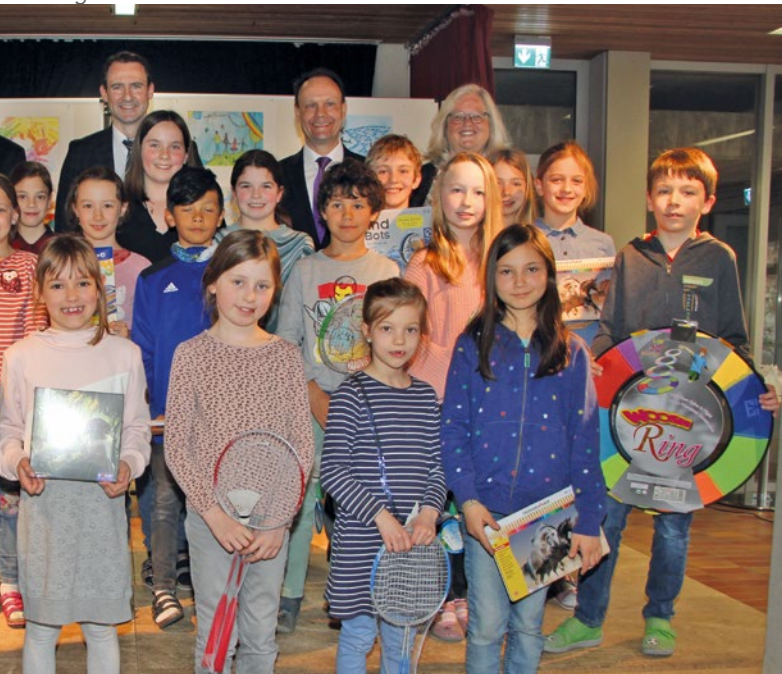
Jahnweg mit ihren Lehrerinnen und den Vertretern der BR-Bank