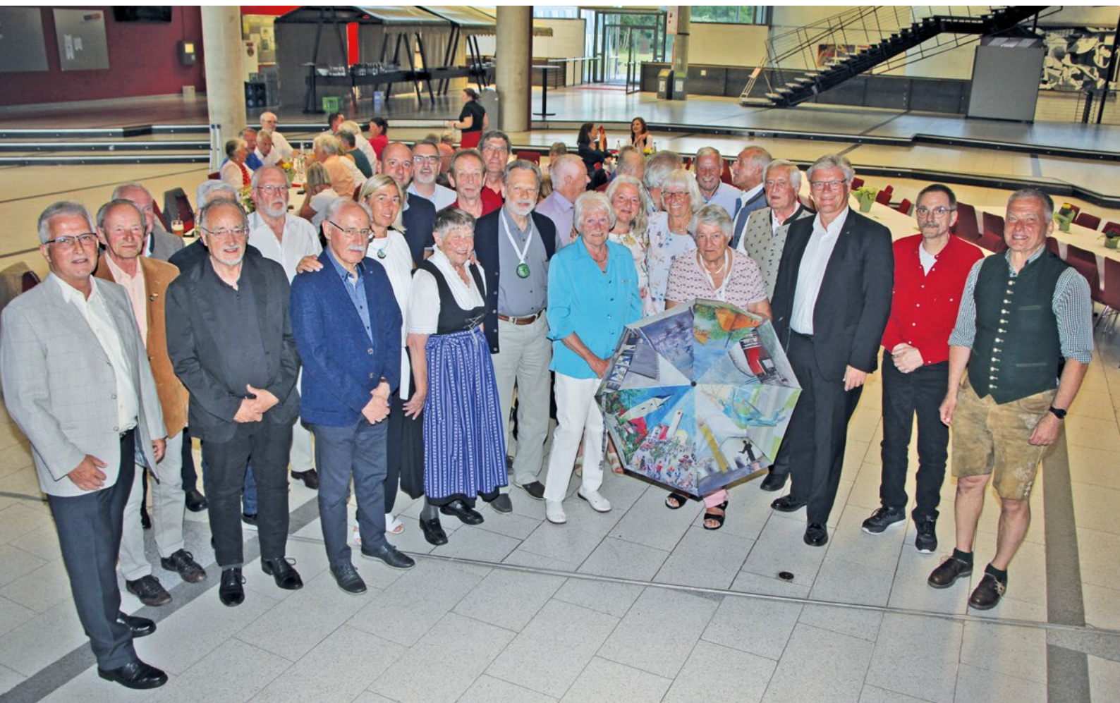
Münze und Neufahrner Regenschirm zum Dank für das große Engagement um die Partnerschaft der Gemeinden Gardolo und Neufahrn

Vor 40 Jahren wurde die Städtepartnerschaft zwischen den Gemeinden Neufahrn und Gardolo mit der Unterschrift der damaligen Bürgermeister besiegelt. Bereits im Frühjahr 2023 wurde dieses Jubiläum in Gardolo gefeiert und