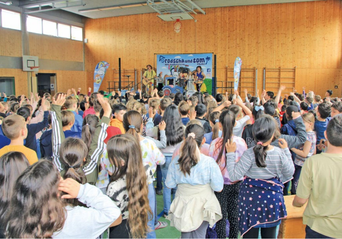
400 Kinder rocken die alte Turnhalle am Jahnweg!