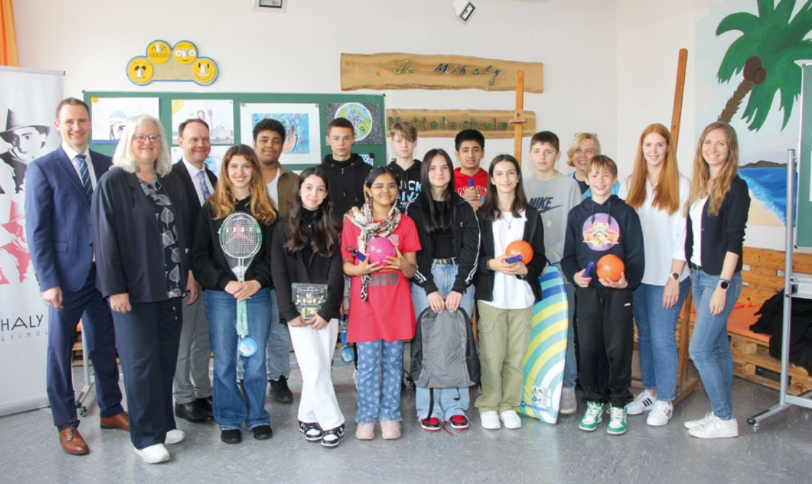
Die Gewinnerinnen und Gewinner des VR-Malwettbewerbs der Jo-Mihaly-Mittelschule.