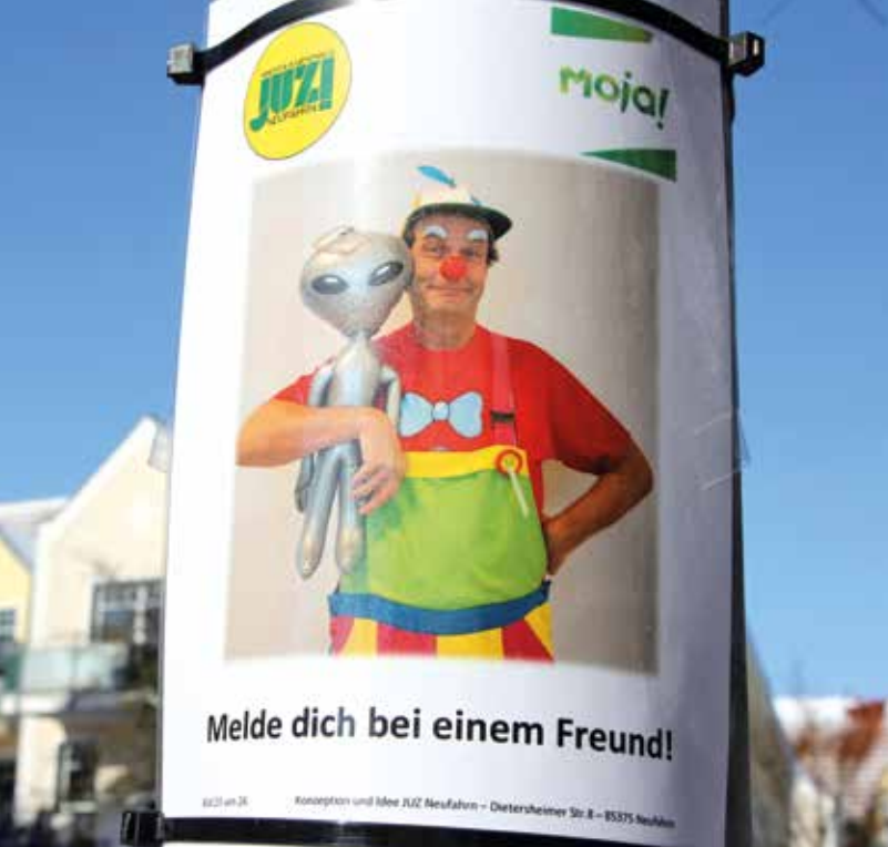
Stimmungsaufhellende Grüße aus dem JUZ – zum Anschauen und Mitmachen